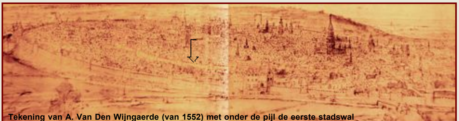
Tekening van A. Van Den Wijngaerde (van 1552) met onder de pijl de eerste stadswal

Als u hier en daar, in de voet van de toren, ook rode blokken ziet, komen die niet van >