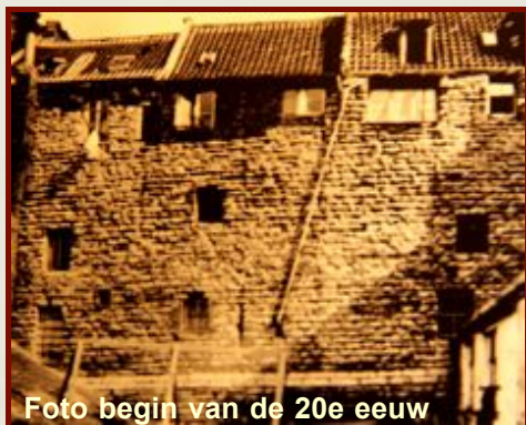
Foto begin van de 20e eeuw

een restauratie met baksteen. Neen, het zijn blokken ijzerhoudende zandsteen die afkomstig zijn van een ouder gebouw, zelfs uit de Romeinse tijd wordt aangenomen. Waarom nu de naam “de muur van Villers” ? Neen, er was daar geen poort die leidde naar de Abdij van Villers La Ville. Maar, volgens een stadslegende heeft het wel iets met dat klooster te maken. In de 13e eeuw kwamen de paters van Villers vaak naar de stad. Het probleem was dat die mannen, eens uit de abdij, zich niet altijd voorbeeldig gedroegen. Daarom besliste vader abt om tegen de stadsmuur een huis te laten bouwen dat voortaan zou dienen als hotel voor de paters van zijn abdij. Links en rechts van dit stukje muur gaat hij nog verder, alleen kunnen we dat niet meer zien omdat grote delen ervan ingewerkt zijn in de gebouwen. Vanaf de 16e tot de 20e eeuw gebeurde dat en op de oude foto kan men zien hoe