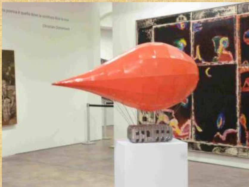
Panamarenko sur fond d'Alechinsky