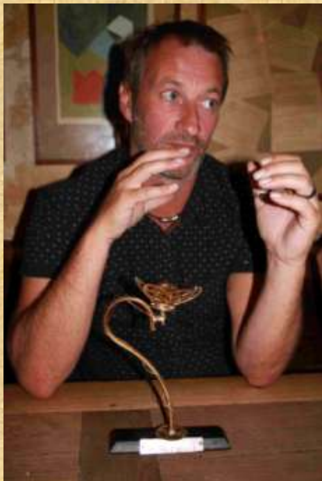
Etincelle met zijn Goudblommeke